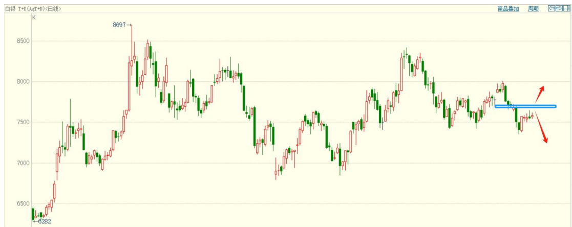
白银 TD 日线图

白银 TD 在反弹高位震荡，日线下跌结构完好，多空分界点 7700 依然有效，激进的依然可尝试高空，严格止损。