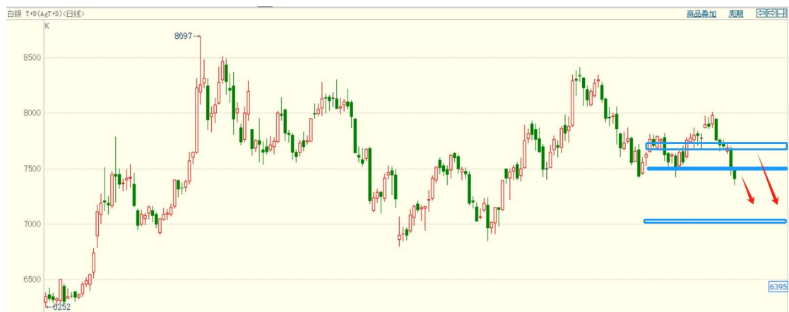
白银 TD 日线图

白银 TD 连续下跌，日线、周线呈现下跌结构，以 30.65（7700）为多空分界点继续高空，关注前期低点 7000 一线支撑。