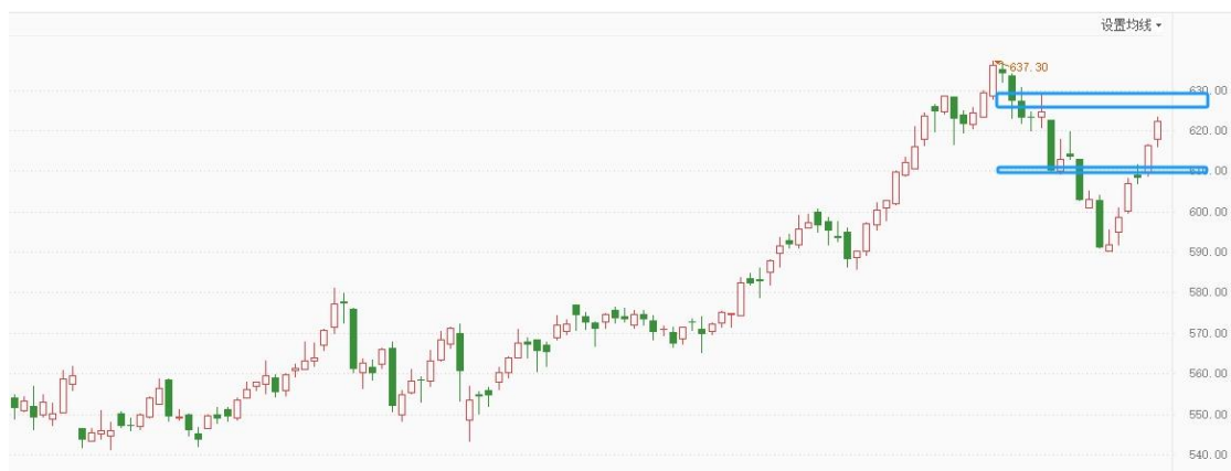
黄金 TD 日线图

黄金 TD 在俄乌冲突恶化驱动下，连续上涨，完全回收上周跌幅，站上中期多空分界点 620，国际金价距离中期多空分界点 2720 还有些距离，反弹有可能已经演变成反转，分时保持上涨结构，但不建议追涨，预计重回宽幅震荡，关注分时结构的变化，等待新的交易信号。