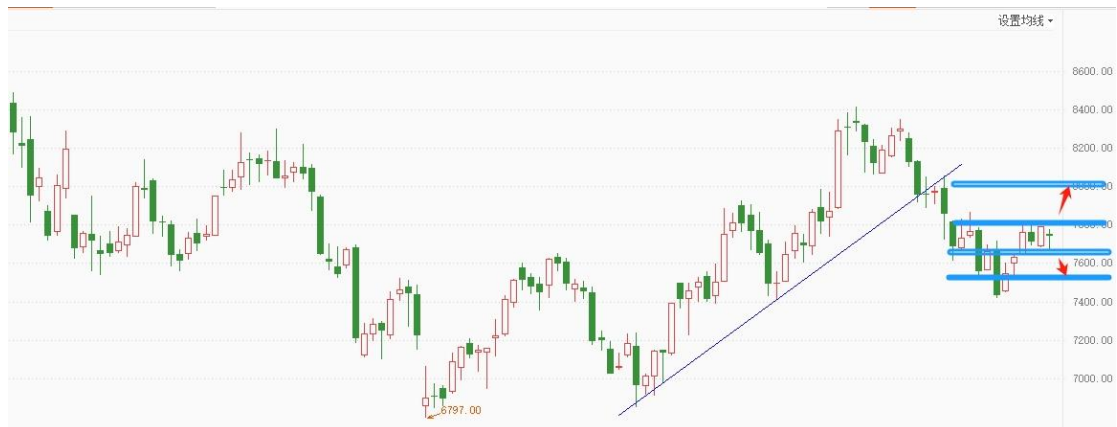
白银 TD 日线图

白银 TD 自 7400 展开反弹，在 7800-7650 形成窄幅横盘整理，目前无法判断反弹是否结束，关注小区间突破，将决定短期方向。