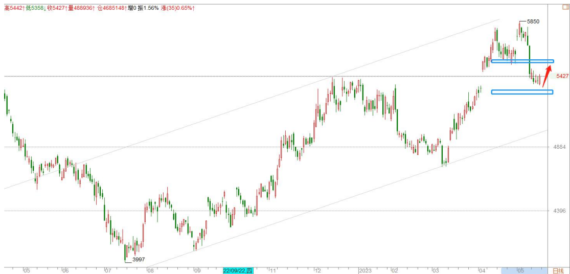
白银 TD 日线图

白银TD在5350一带显示了较强支撑，但日线下跌结构保持完好，还不足以判断调整结束，继续关注5350-5300一线支撑，及日线结构的转化。保守的等待新的买入信号，激进的可尝试轻仓逢低做多。