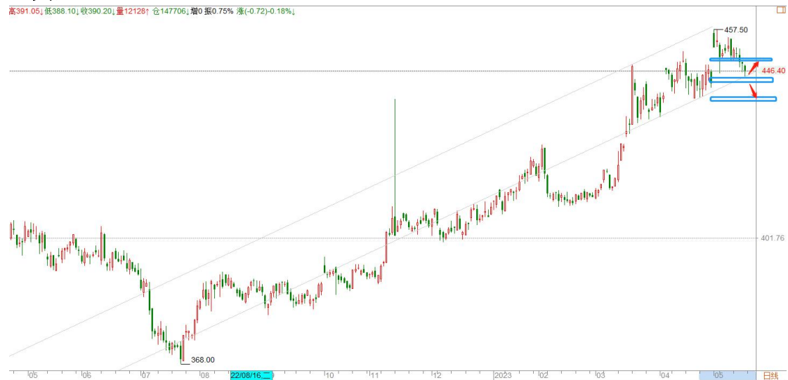
黄金 TD 日线图

黄金持续调整，国际金价击穿中期多空分界点 1970 一线，中期方向转空，短期目标 1935 一线。黄金 TD 由于受人民币汇率影响，相比较抗跌，整体维持在日线上升通道当中，目前考验通道底边 444 支撑，短期不论是基本面还是技术面都不具备大幅杀跌的动能，预计震荡偏下的可能居多。