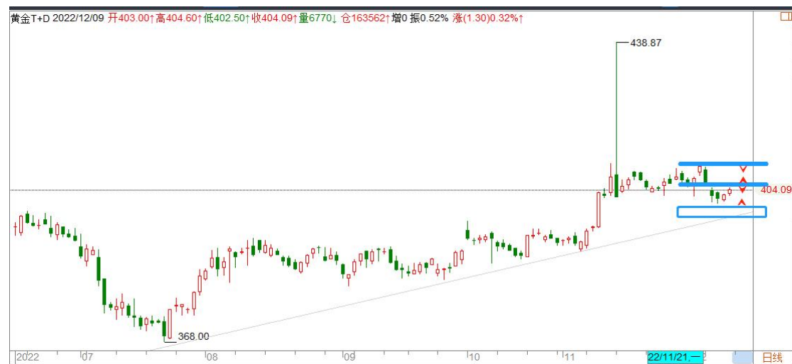
黄金 TD 日线图

黄金 TD 意外在 402-410 箱体向下突破，旗形结构失败，405.50 成为短期多空分界点，上破将再次测试区间顶部 410 一线，反之有机会测试 395 一线，短期难以摆脱宽幅震荡。