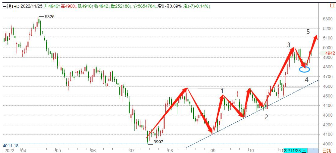
白银 TD 日线图

白银 TD 短暂调整后回升，各周期上涨结构保持完好，目前有可能处于第 3 浪或者 C 浪主升浪中的第 5 子浪，以 4800 为多空分界点继续看涨。不过第 5 浪也意味着波段涨势接近尾声，更多的可能是震荡偏上，不宜过度追高。