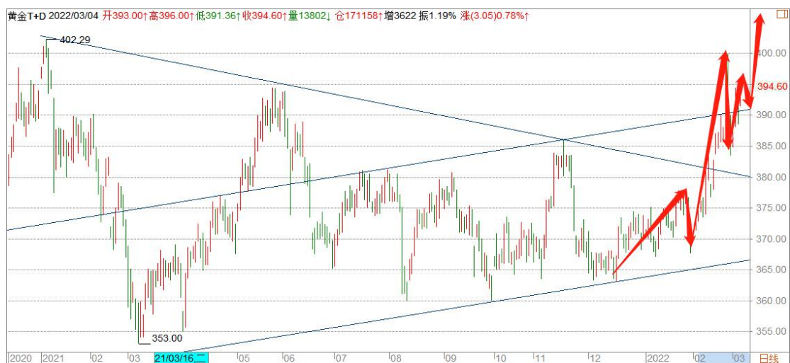
黄金 TD 日线图

黄金 TD 短暂调整后重新站上通道顶边，目前有在该位置构建三角形整理的迹象，调整过后有望加速上涨。关注分时结构的转换。