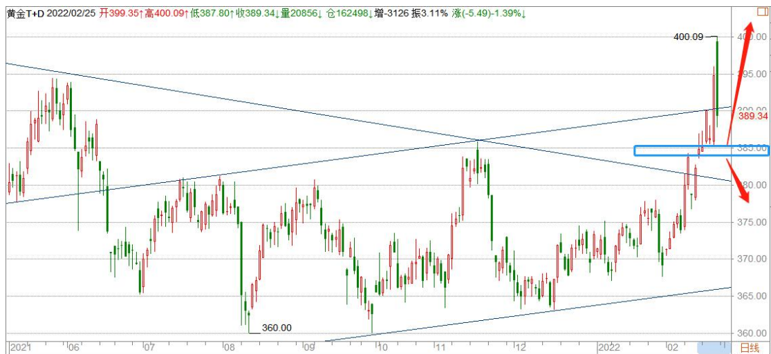
黄金 TD 日线图

黄金 TD 突破上升通道顶边加速拉升，并快速回落通道顶边，日线。周线形成上涨结构，分时转下跌结构，关注通道顶边一带争夺，如能企稳，仍将继续上涨，暂以 386 为多空分界点继续看涨。