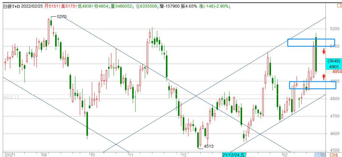
白银 TD 日线图

白银 TD 日线形成新的上升通道，关注 5200 一带压力，一旦有效站上，白银将形成中期底部。短期预计维持在上升通道中震荡。