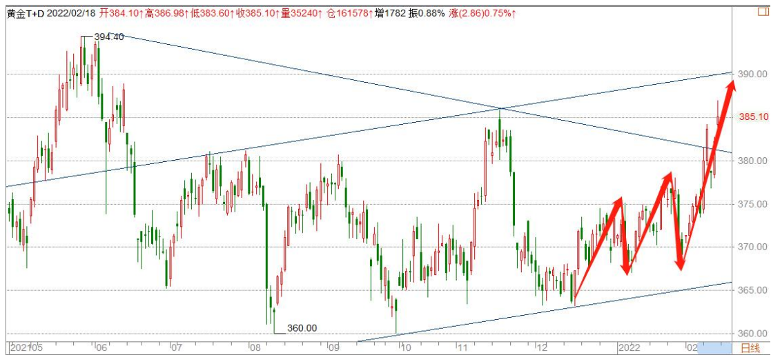
黄金 TD 日线图

黄金 TD 连续大幅上涨，并创 8 月新高，日线依然处于小角度的上升通道中，周线则实现了三角形突破，短线有望冲击上升通道顶边区域，警惕冲高后的回落风险。由于近期金价的上涨更多由风险事件驱动，容易出现暴涨暴跌的走势，注意把控风险。关注大三角顶边支持，保守的等待调整后的买入机会。