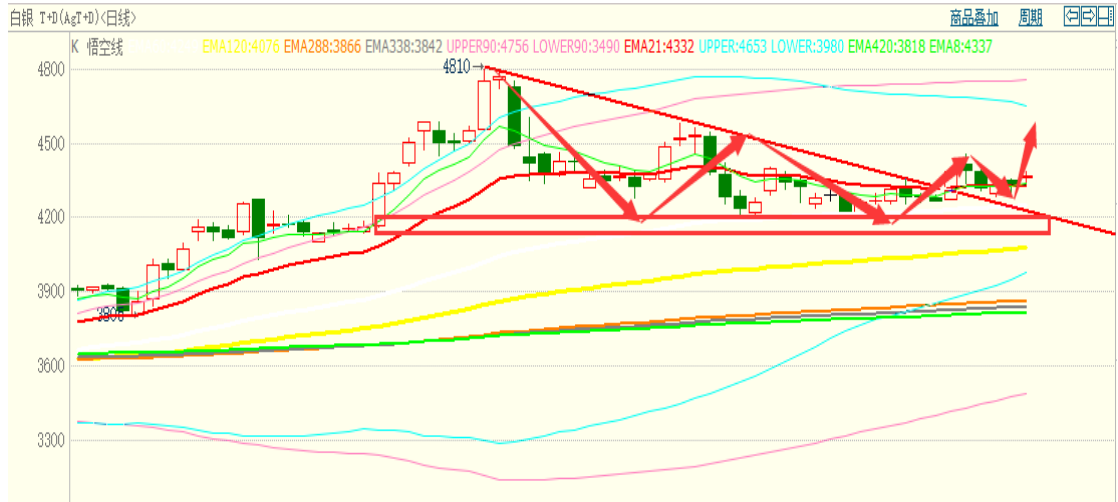
白银 TD 日线图

从日线图表观察来看，白银 TD 在突破三角形整理区间后经历了回踩确认，随后银价再次走高，重心在上移。白银阻力：18.7（4500），支撑：17.6（4280）。