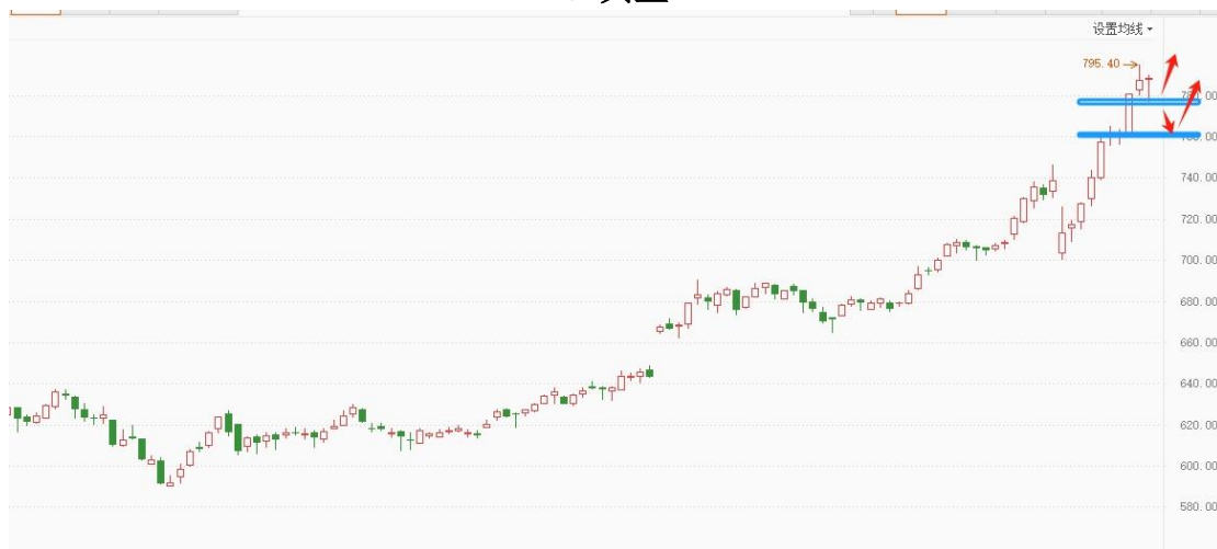
黄金 TD 日线图