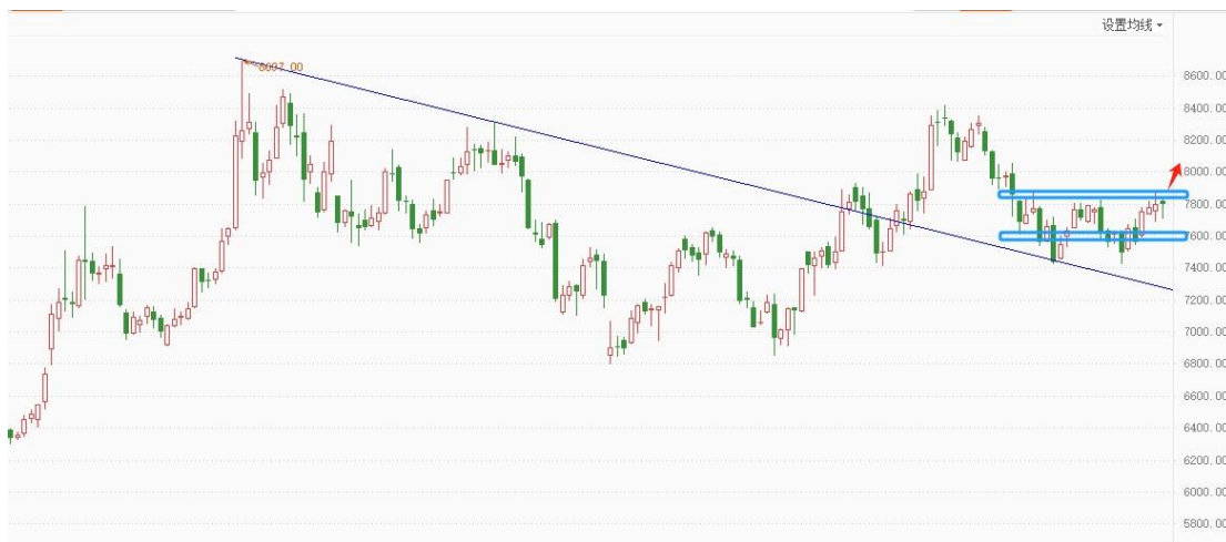
白银 TD 日线图

白银 TD 日线形成新的上涨结构，短线关注 7880 一线阻力，上破将打开上行空间，激进的可逢低尝试多单，多空分界点定在 7600 一线，短线预计更多的还是震荡。