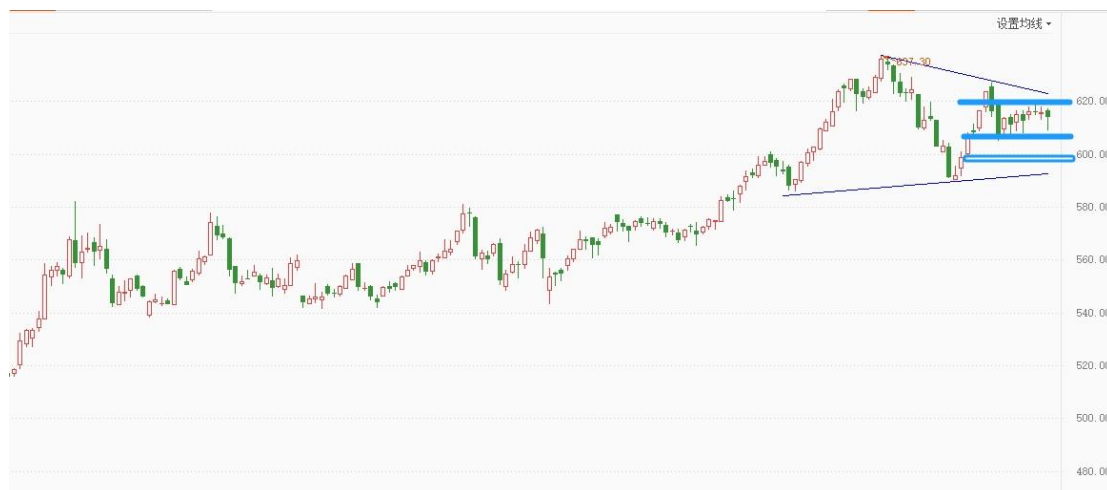
黄金 TD 日线图

黄金 TD 呈现窄幅横盘整理，整体有望形成日线大三角形态，激进可在大三角区域高抛低吸，保守观望，等待明确信号。