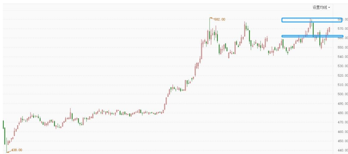
黄金 TD 日线图

黄金 TD 持续反弹，有冲击历史高点迹象，整体仍是宽幅震荡，短线关注2400（562-60）一线支撑。操作上激进的可区间内高抛低吸，保守的等待高位做空信号。