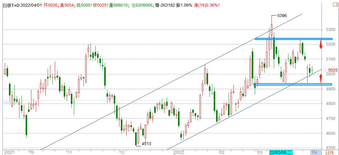
白银 TD 日线图

白银 TD 考验上升通道底边支撑，21 年 8 月份以来高点区域 5200 上方显示强阻，4930-5230 形成宽幅震荡，区间突破决定白银中期方向。