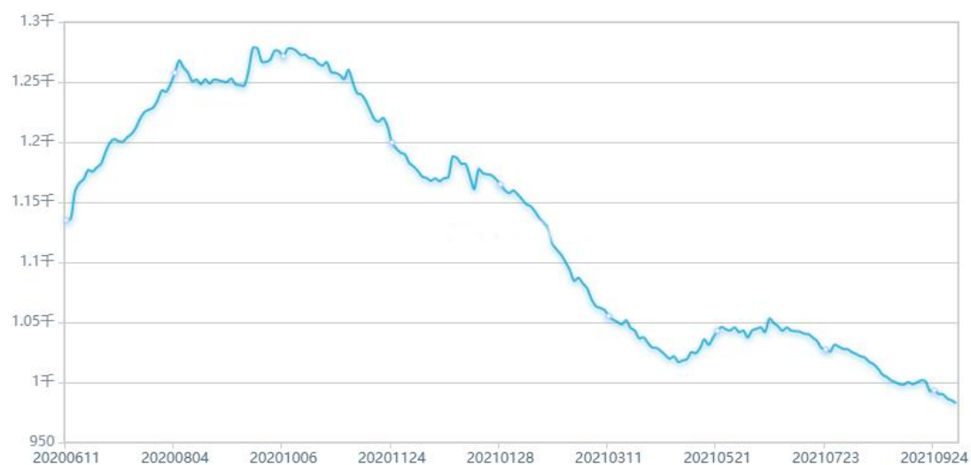
全球最大黄金 ETF—SPDR GOLD TRUST 持仓

全球最大黄金 ETF—SPDR GOLD TRUST 持仓报告显示自 2020 年 9 月，ETF 持仓持续下降，由最高的 1278.82 吨，下滑至目前的 982.72 吨。如下图所示：