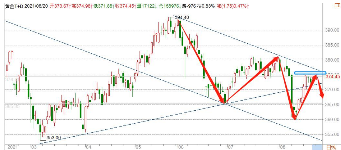
黄金 TD 日线图

黄金 TD 强力反弹至日线下跌趋势线附近，停留在压力线下方窄幅横盘震荡，是上涨途中的震荡蓄势还是转折？目前还无法判断，遵循趋势没有发生改变之前顺着原有趋势交易，仍可逢高做空，破位严格止损。