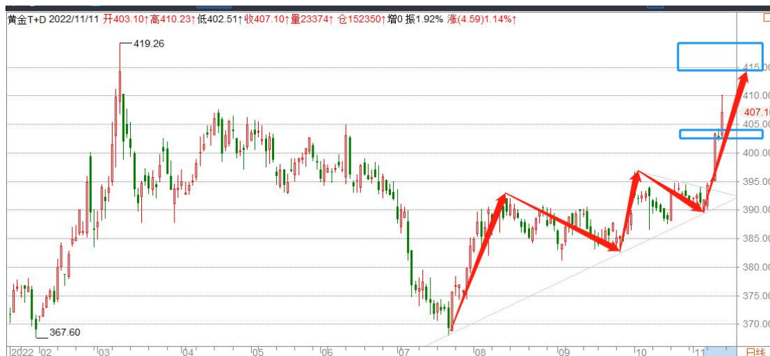
黄金 TD 日线图

国际金价一举突破周线级别的下跌通道，展开单边上涨行情，周线扭转 3 月份以来的跌势形成新的上涨结构，上方关注前期高点 1800（415）一线压力。由于连续上涨，警惕随时可能发生的技术性调整。