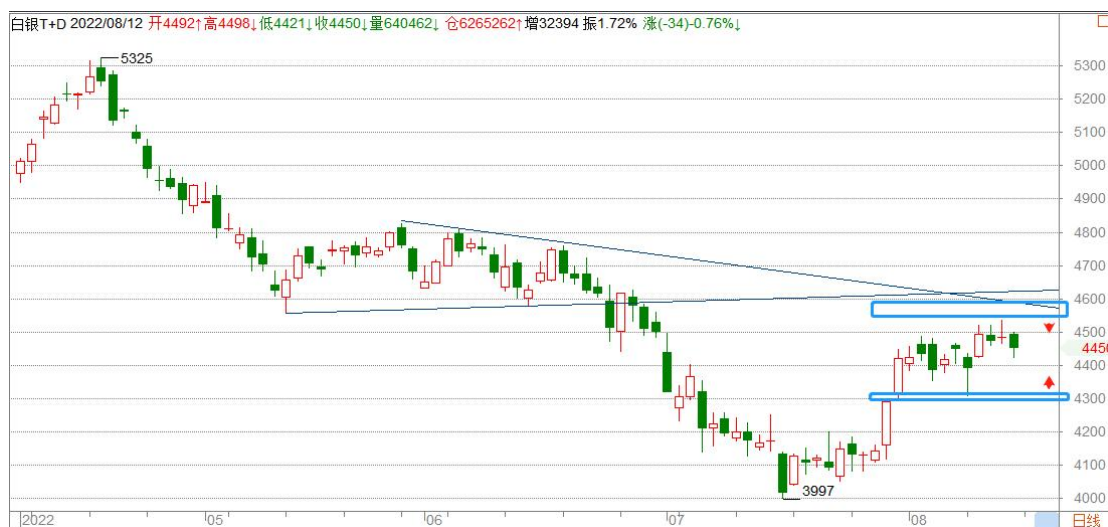
白银 TD 日线图

白银 TD 日线上涨结构保持完好，在关口下方震荡加剧，短期预计维持目前的宽幅震荡，可在震荡区间高抛低吸。