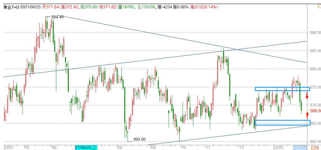
黄金 TD 日线图

黄金 TD 在前期密集成交下方无功而返，大幅下挫，呈现宽幅震荡，整体仍处于自去年 1 月以来形成的三角形当中，关注三角形底边支撑，短期预计维持区间震荡。从周线看，自 21 年 11 月以来涨势缓慢，在未触及三角形底边之前，交易上倾向于逢高做空。