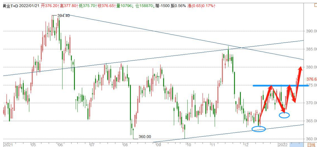
黄金 TD 日线图

黄金 TD 突破 375 关口，日线形成新的上涨结构，整体依然处于小角度的上升通道当中，但周线下跌结构保持完好，关注周线下跌趋势线 382 一线阻力。短线上涨动能充足，有可能反复的试探上方压力。操作上维持逢低买入策略。