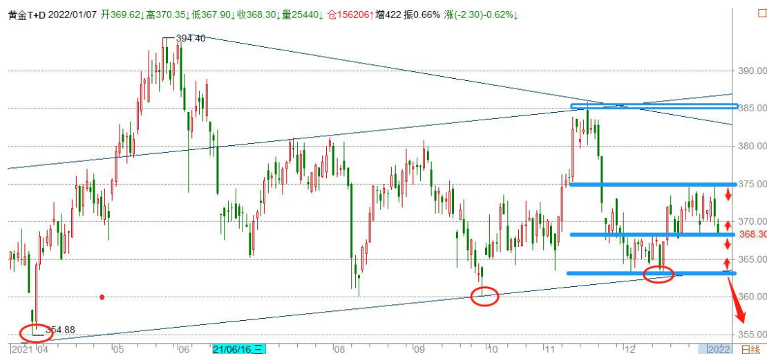
黄金 TD 日线图

黄金T+D 2022/01/07 开369.62|高370.35|低367.90|收368.30|量25440|仓156206|增422 振0.66% 涨(-2.30)-0.62%