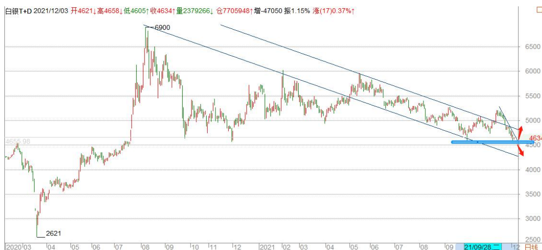
白银 TD 日线图

白银 TD 向上突破日线级别下跌通道后很快回落通道，形成假突破，目前分时、日线均形成下跌结构，去年 8 月以来的低点面临考验。从短时形态看，白银的下跌更为坚定，而且跌势未尽，有击穿前期低点的迹象，关注分时结构的转换，暂时观望。