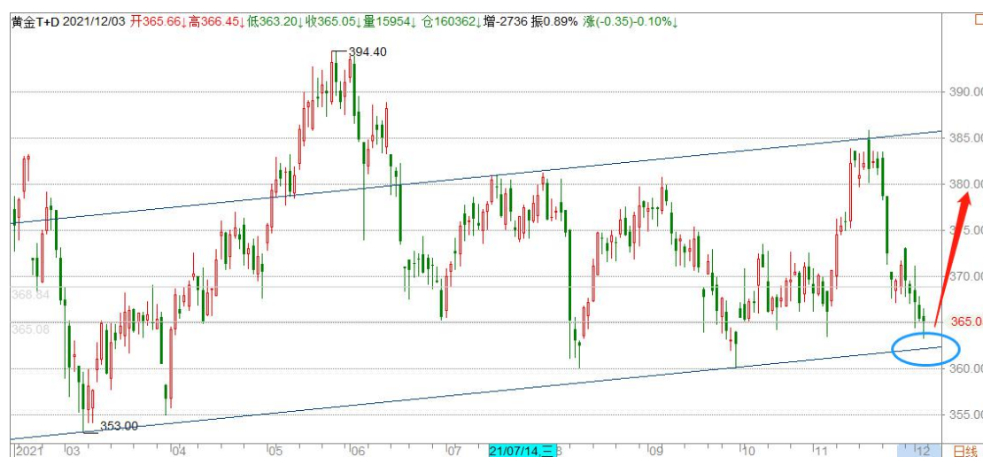
黄金 TD 日线图

黄金 TD 大幅快速下跌后经过微弱反弹，转为震荡下跌，跌势趋缓，目前处于宽幅震荡区间底部位置，就年内波动区间而言，跌势似乎已到尽头，但如果一旦击穿这个底部，将打开下行空间。晚间将公布美国非农就业数据，黄金有可能借此机会做出方向性选择。