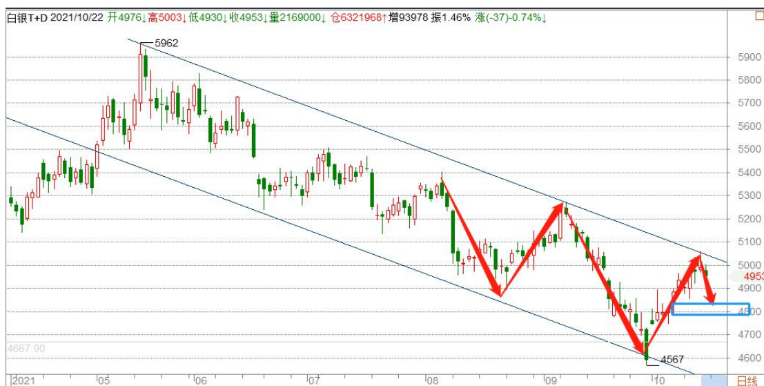
白银 TD 日线图

白银 TD 维持下跌通道运行，目前在通道顶部区域受阻回落，需要注意的是国际白银已经突破下跌趋势线压制，白银 TD 经过调整后能否向上突破下跌通道？短线有向下调整的需求，关注 23（4800）一带支撑。