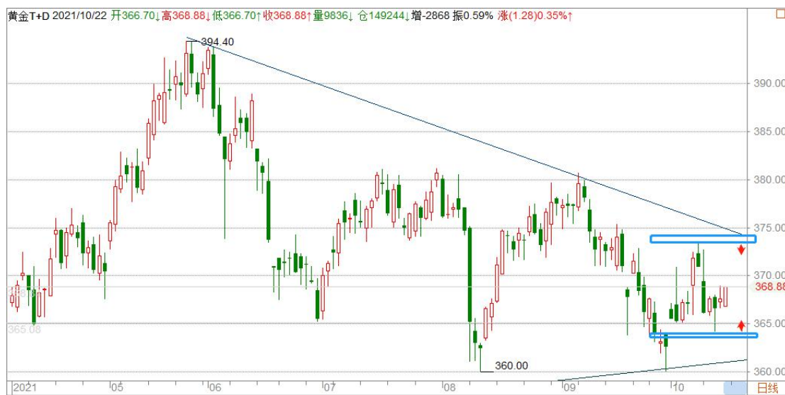
黄金 TD 日线图

黄金 TD 整体处于一个收敛的宽幅震荡当中，短期预计维持目前的区间震荡，由于临近传统销售旺季，分时及日线均呈现上涨结构，短线偏向上走，有望测试下跌趋势线附近压力，一旦向上突破，将有可能升至 380 一线。操作可高抛低吸，注意分时结构的变化，把握交易节奏。