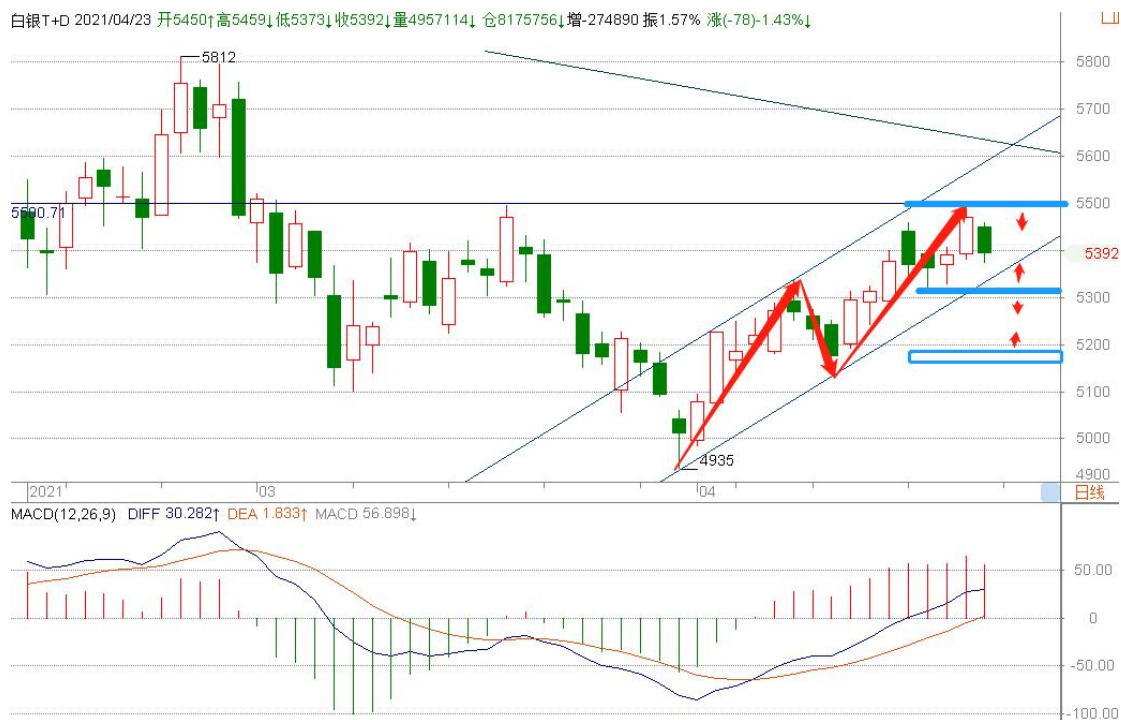
白银 TD 日线图

白银 TD 日线如期涨至 5500，完成 AB=CD 涨幅，在 5500 显示明显阻力出现较大幅度的回调，但整体反弹结构保持完好，分时呈现多头结构，关注通道底边支撑，下破将对 4935-5500 涨势展开回调，短期上涨动能还在，即便回调仍有机会回试高位，转入区间波动。目前价位而言，向上的空间要小于向下的空间。激进的可关键阻力支撑高抛低吸。