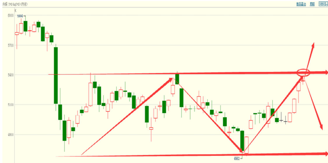
白银 TD 日线图

从日线图表观察来看，白银 TD 已从前期底部区域脱离，逐渐上行至前高阻力区域，若能继续突破，恐将引发更大行情。白银压力：26、27（5400、5600），支撑：25（5200）。