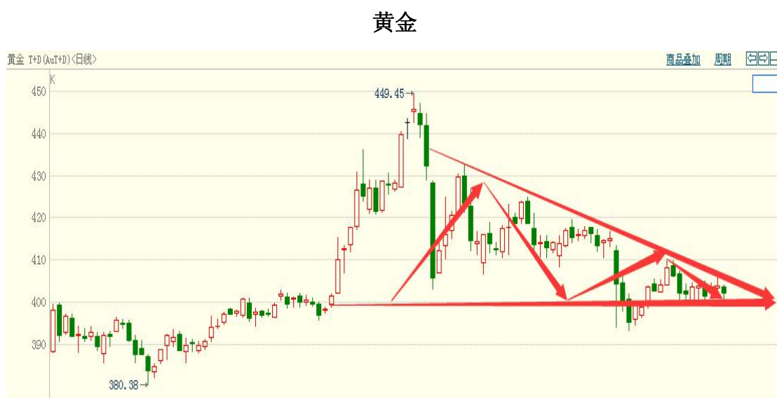
黄金 TD 日线图