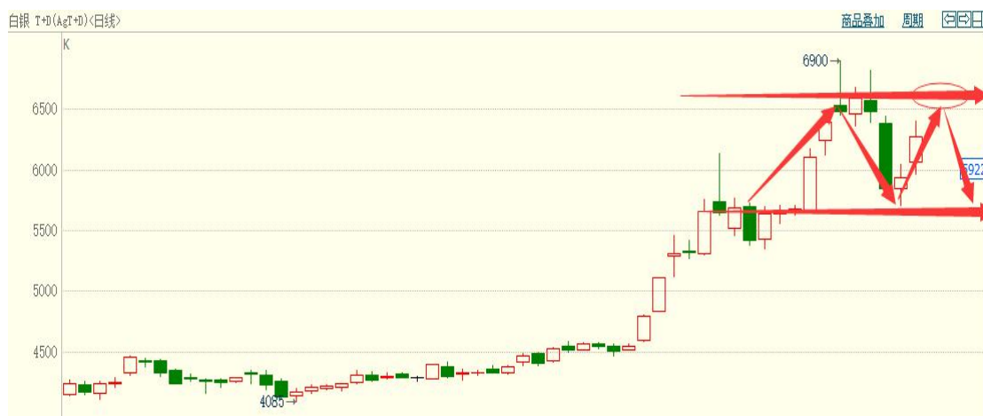
白银 TD 日线图